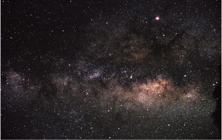
Imagen de los Cielos de La Palma tomada el 20 de Abril de 2007, la misma noche en que fue adoptada la Declaración.